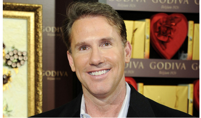
بقلم علياء طلعت

الكتابة هي فن تحويل الأفكار إلى كلمات تصل إلى قلوب وعقول القراء، ولكن في بعض الأحيان تصبح كذلك متنفساً للكاتب، يعبر بها عن آلامه، سواء في خاطرة، أو بيت شعر، وبالطبع فن الرواية لم يخلُ من ذلك. ونتكلم اليوم عن كاتب أمريكي.